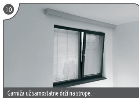
Garniža už samostatne drží na strope.