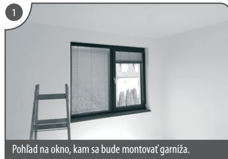
Pohľad na okno, kam sa bude montovať garniža.

Na nasledujúcich fotografiách je znázornený jednoduchý montážny postup sadrokartónovej garniže. V tomto prípade bola garniža upevnená do betónového stropu. Pri montáži do sadrokartónového stropu je garniža kotvená skrutkami do nosnej konštrukcie podhladu. Ak je potrebné spojiť viac prefabrikátov, ich spoje treba pretmeliť sadrou, prepáskovať a následne prebrúsiť. Spoje medzi stenou a garnižou sa vyplnia akrylovým tmelom. V prípade väčších nerovností stropu alebo steny je potrebné medzery vyplniť sadrou na sadrokartón a prepáskovať.