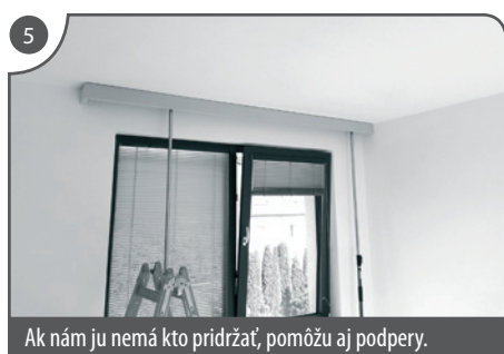
Ak nám ju nemá kto pridržať, pomôžu aj podpery.