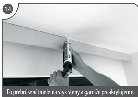
Po prebrúsení tmelenia styk steny a garniže preakrylujeme.