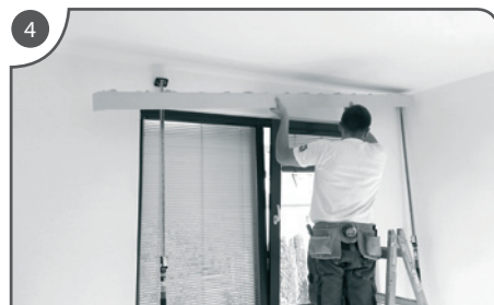
Garnižu osadíme na určené miesto.