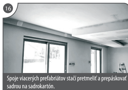
Spoje viacerých prefabrikátov stačí pretmeliť a prepáskovať sadrou na sadrokartón.