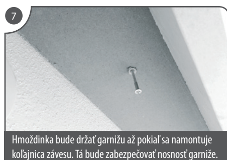
Hmoždinka bude držať garnižu až pokiaľ sa namontuje kolajnica závesu. Tá bude zabezpečovať nosnosť garniže.