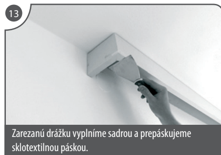
Zarezanú drážku vyplníme sadrou a prepáskujeme sklotextilnou páskou.