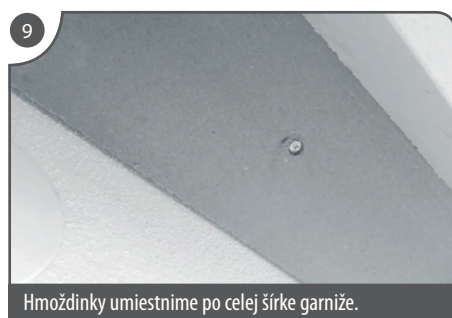
Hmoždinky umiestnime po celej šírke garniže.