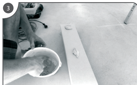
Na prílepenie a zrovnanie podkladu sa použije sadra.