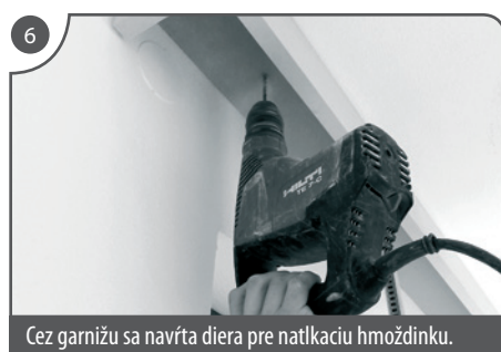
Cez garnižu sa navrtá diera pre natlakovú hmoždinku.