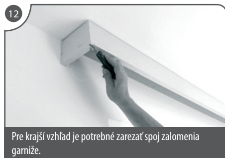
Pre krajší vzhľad je potrebné zarezať spoj zalomenia garniže.