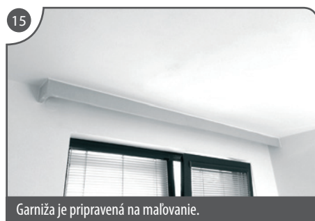
Garniža je pripravená na maľovanie.