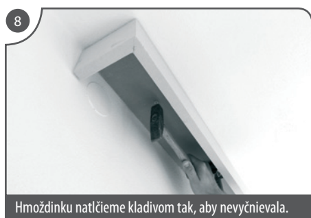
Hmoždinku natlačíme kladivom tak, aby nevyčnievala.